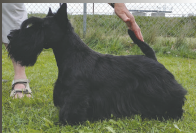
FILISITE BRASH WHY ALONE STAR