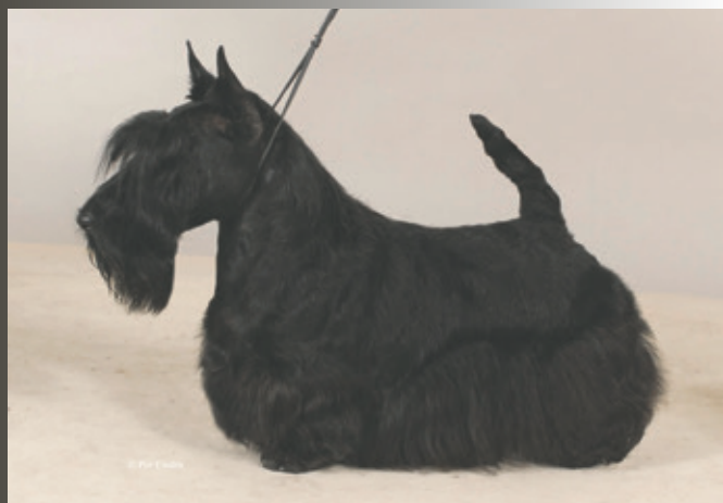
FILISITE BRASH KINGLY STEP