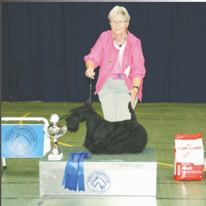
FILISITE BRASH KINGLY STEP

også de gange, hvor jeg tænker, hvor har pågældende dommer haft sit hoved, sine øjne og sine hænder, men også det lærer man noget af.