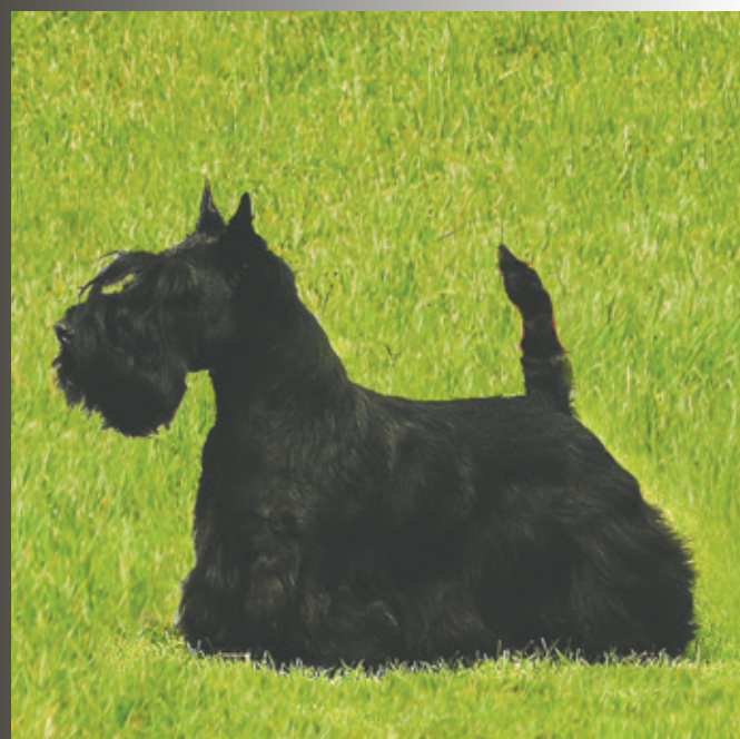
FILISITE BRASH WHY ALONE STAR