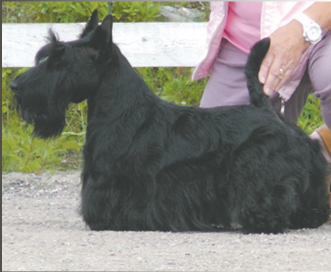
FILISITE BRASH KINGLY STEP